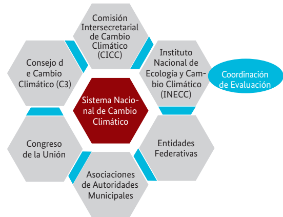
Figura 1 Marco Institucional del Sistema Nacional de Cambio Climático